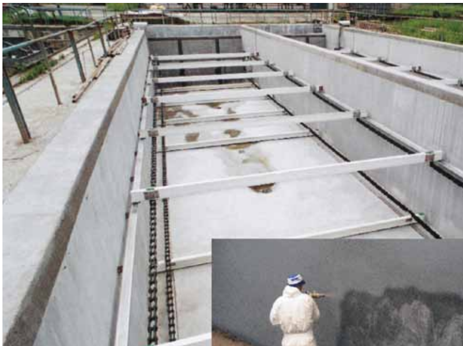
Application par projection de VANDEX POLYCEM Z